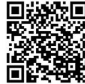
Spécial famille : Chasse au trésor avec Jack le Plagnou

Plusieurs projets ont déjà vu le jour : une course d'orientation hiver et été à Champagny le Haut, deux jeux et balades interactifs dans le village accessible gratuitement. Il suffit d'installer l'application Geodyssée.