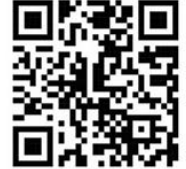
Les secrets de Champagny : Patrimoine et histoire